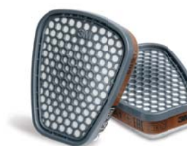
Filtre antigaz & vapeurs 3M™ 6051i

Aide les utilisateurs à déterminer quand changer leurs filtres dans des environnements appropriés ou peut être utilisé pour compléter un programme actuel de changement de filtre.