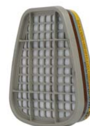
Filtre antigaz & vapeurs 3M™ 6057

Peut être utilisé avec tous les demi-masques et masques complets avec ou sans filtres contre les particules.