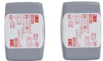
Filtres antipoussière 3M™ 6035

La coque du filtre 6038 protège également contre les étincelles et la chaleur élevée.