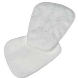
Filtres antipoussière 3M™ 5911

Particulièrement utile si vous devez changer le filtre contre les particules plus souvent que le filtre antigaz et vapeurs.