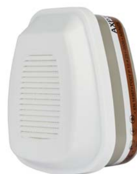
Filtre combiné 3M™ 6098

Ainsi que les classifications des filtres 6096 et 6099 qui ont été étendues pour couvrir des contaminants supplémentaires.