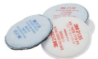
Filtres antipoussière 3M™ série 2000

Ces filtres résistent à l'abrasion et à l'humidité.