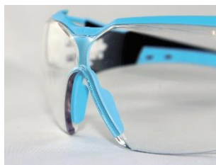
x-tended eyeshield couverture parfaite